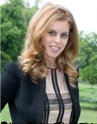
Известни личности с дислексия: Беатрис Елизабет Едвардс, 1981 г.р. (Фотоснимък, Великобритания)