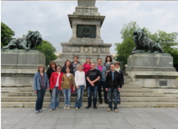
Група от учители и ученици от Бургаския университет, Бургас, България, участващи в програмата Erasmus+.