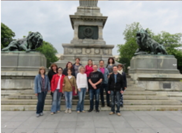
Група от участници в семинара на 05.06.2017 г. в Букурещ, работилница за обучение в четирите